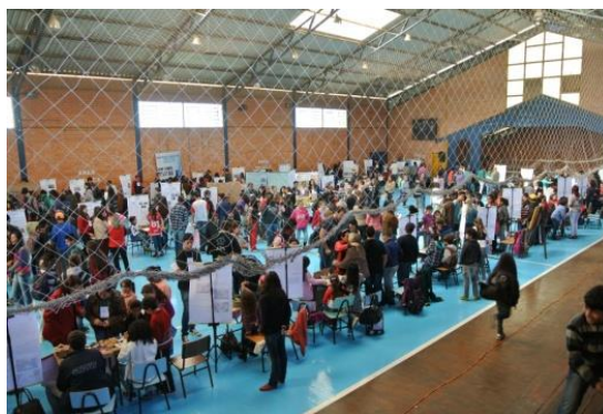
Figura 2 – Visitação dos trabalhos da III FEICAN (2015).

Na análise pode-se observar um aumento significativo no número de trabalhos apresentados na edição de 2015 (Fig.1), em comparação aos anos anteriores. A Feira de Candiota iniciou-se em 2013 e mostra uma certa flutuação em torno de 40 trabalhos. A Feira de Bagé mostra um incremento de trabalhos em 2015, que reflete o início da colaboração com a Feira de Ciências de Dom Pedrito.